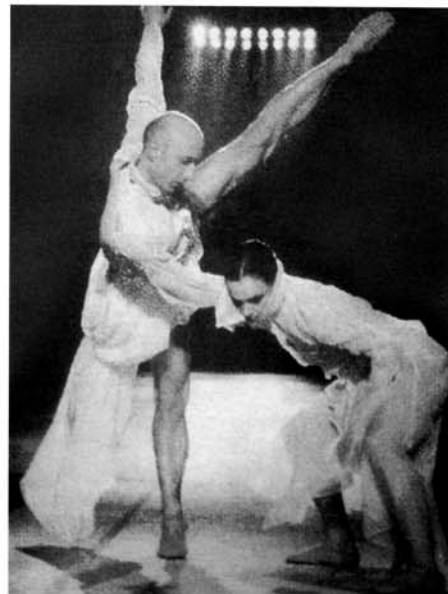
Stabile Beinachse in der Belastung. Das Knie ist so vor Verletzungen geschützt.