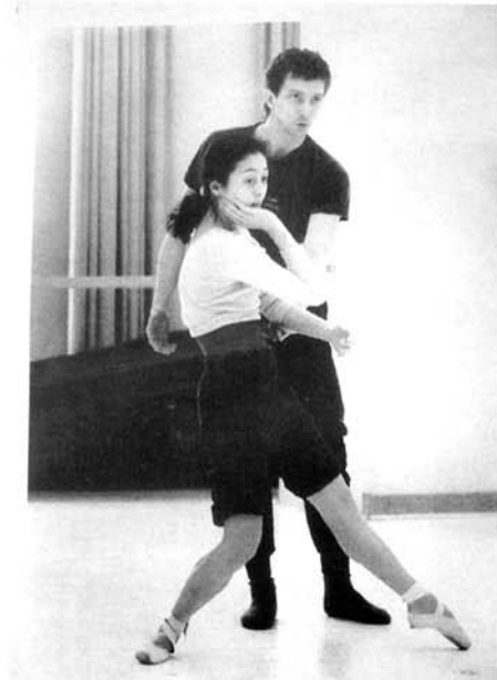
Hohe Belastung im rechten Knie durch fehlende Verschraubung der Beinachse.

(Überprüfen Sie die Tanztechnik unter folgenden Aspekten: ● Wird das „en dehors“ aus den Knien erzwungen? ● Wird auf die Innenkanten der Füße gerollt? ● Wird das Standbein überstreckt? ● Werden beim Strecken der Beine die Kniescheiben maximal nach oben gezogen?)