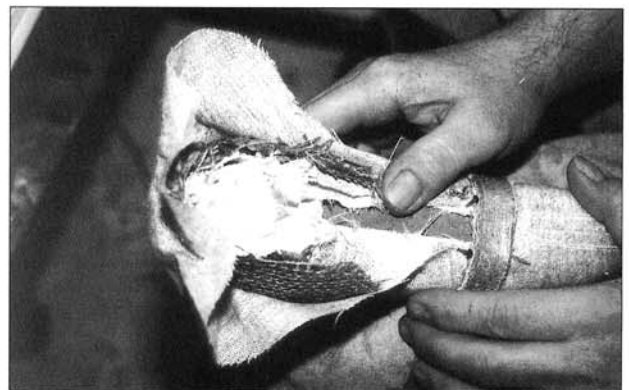
Abbildung 2: übereinandergelimeite Rupfschichten

Der Spitzenschuh wird überwiegend aus natürlichen Materialien hergestellt, d.h. aus Seide, Leinen, Pappmaché-Ledergemisch und Kartoffeldextrin. So wird der